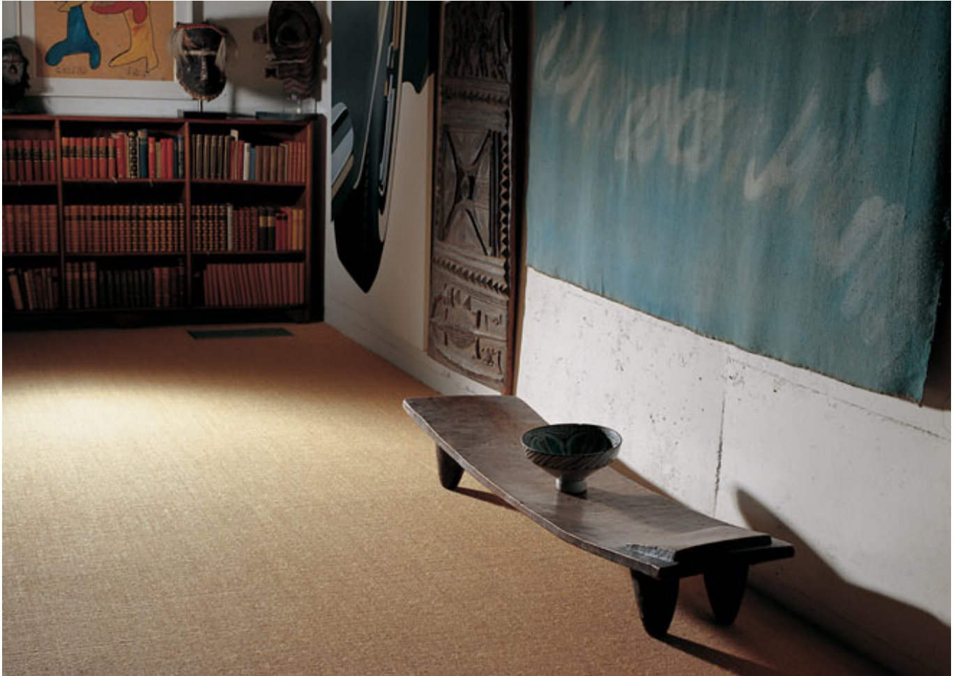
Jaipur 20022 natur