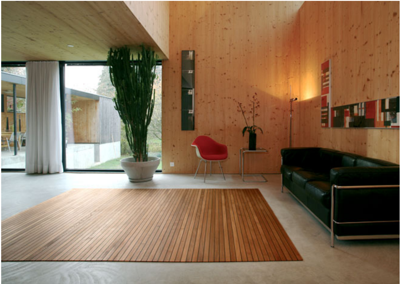
Legno-Legno 205 (Eiche geölt)