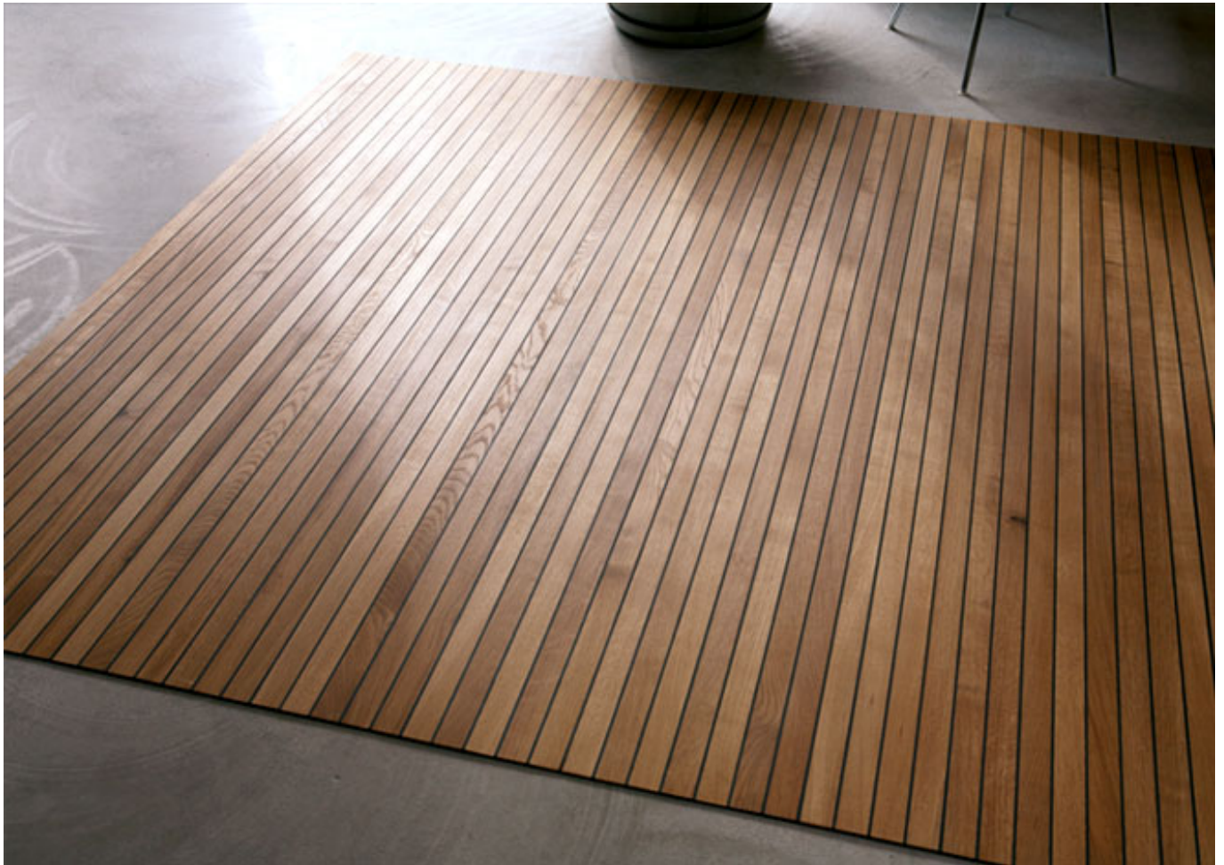
Legno-Legno 205 (Eiche geölt)