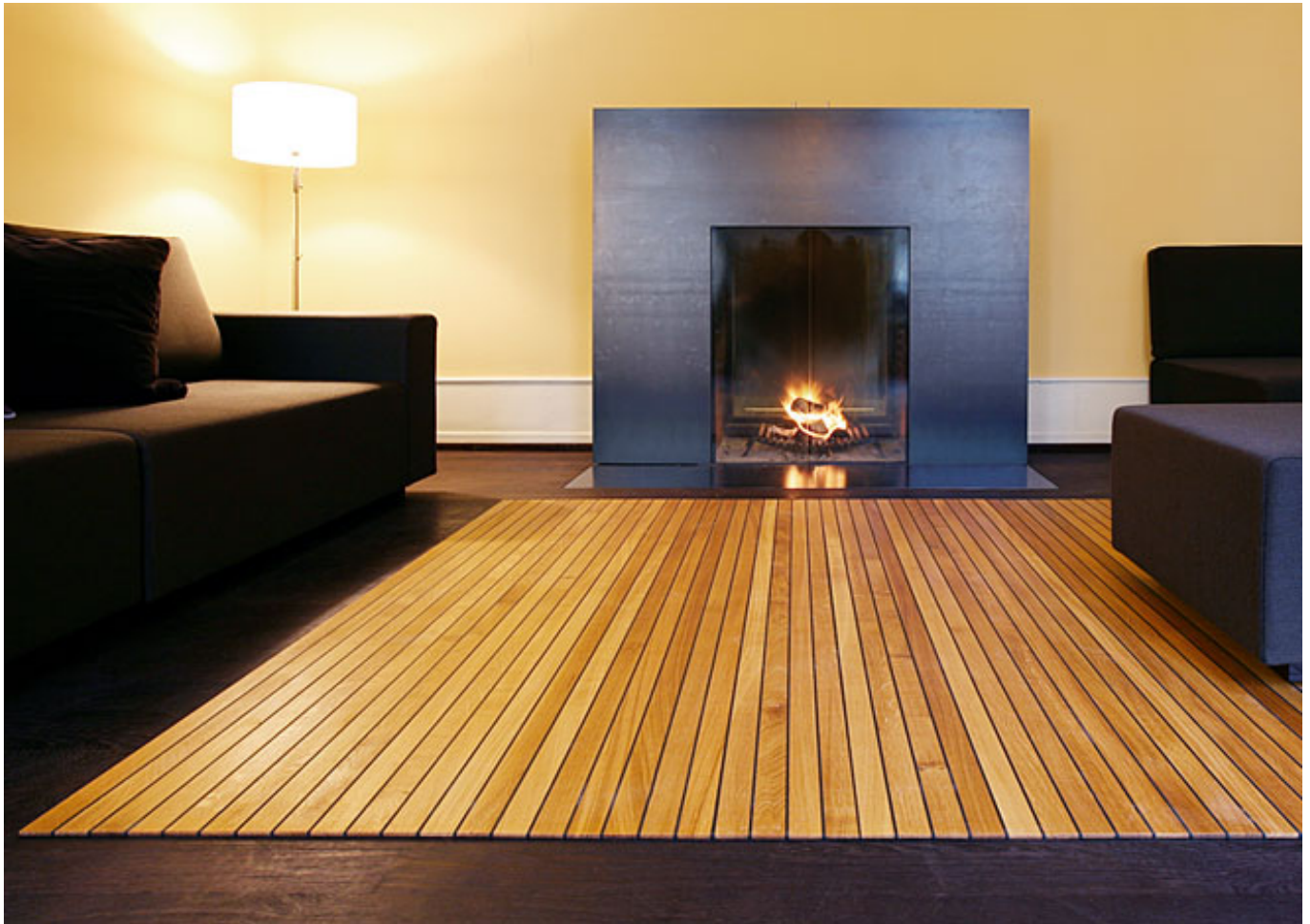
Legno-Legno 205 (Eiche geölt)