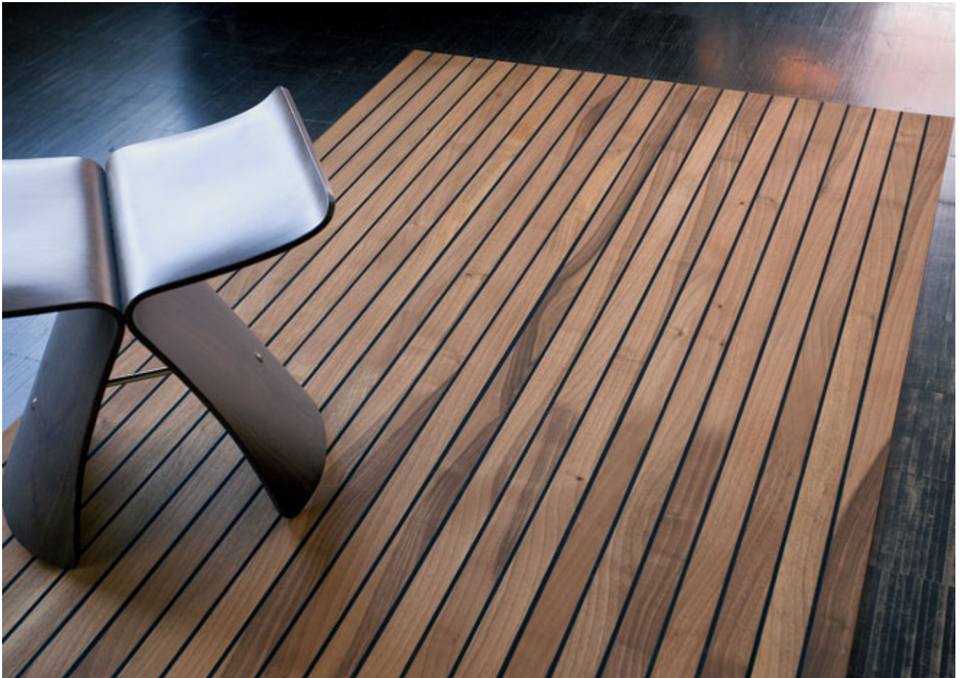
Legno-Legno 241 (Nussbaum geölt)