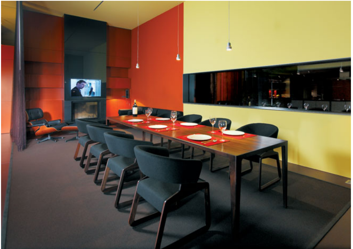
Flatwool Simple 613