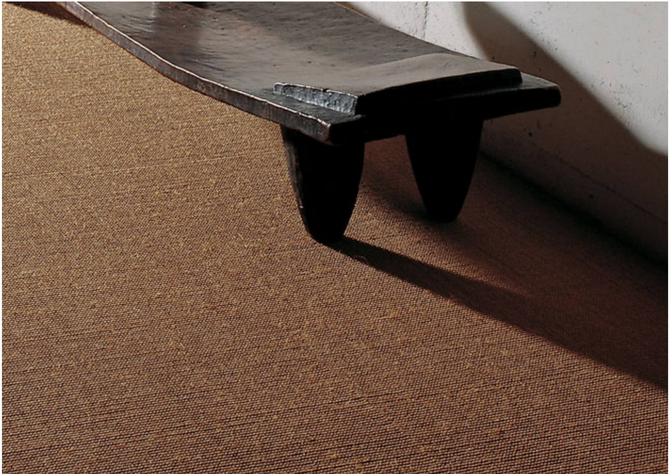
Jaipur 20022 natur