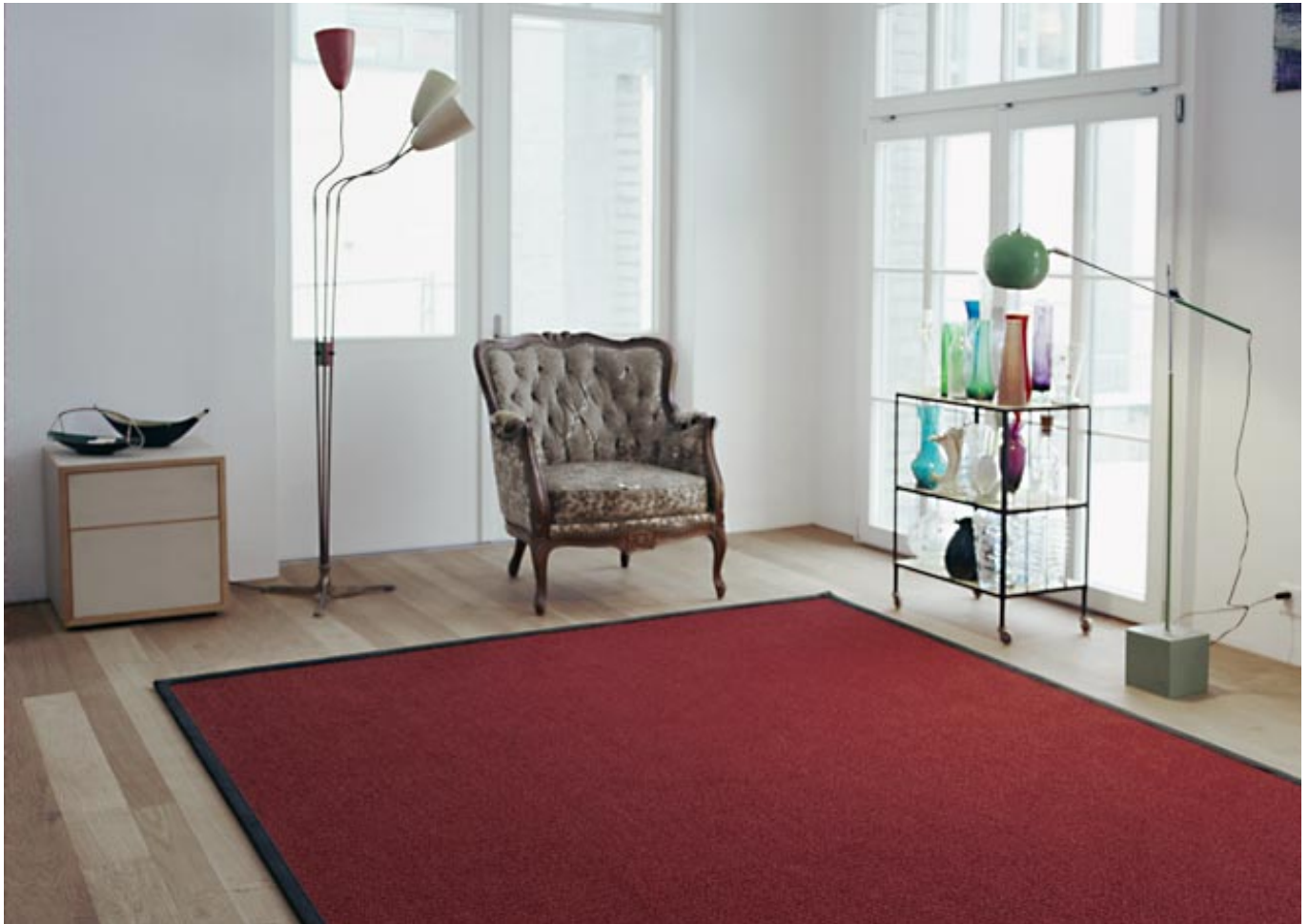
Manila 10213 chinarot