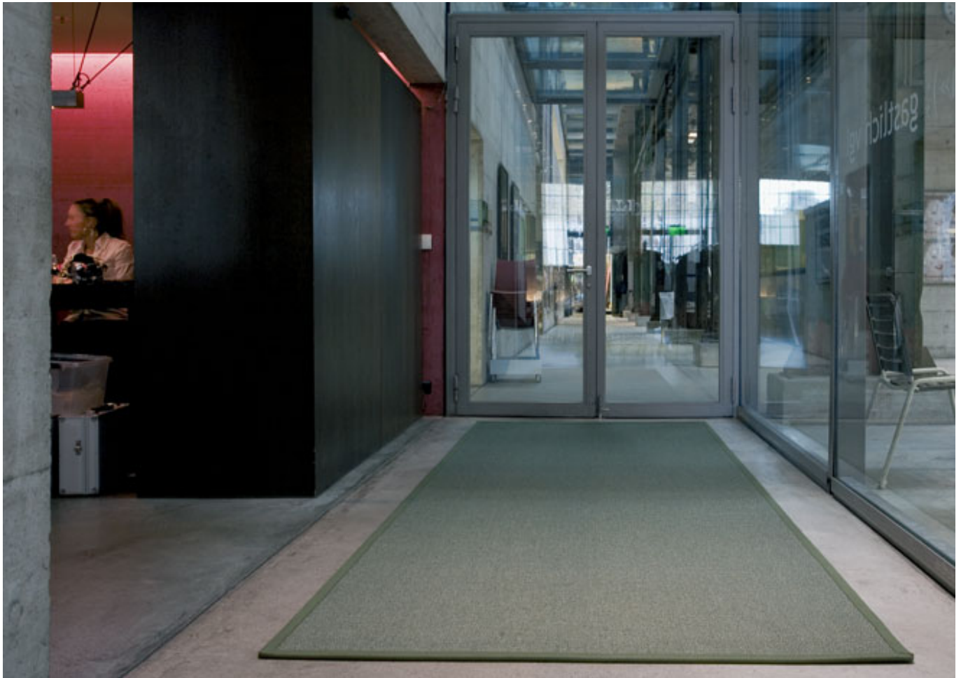
Manila 40161 schlamm