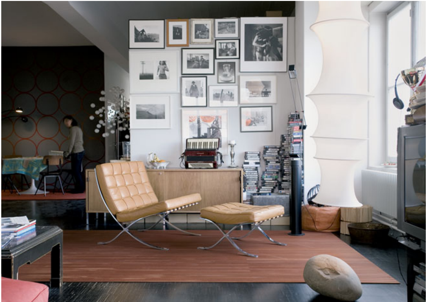
Legno-Legno 274 (Hêtre vaporisé)