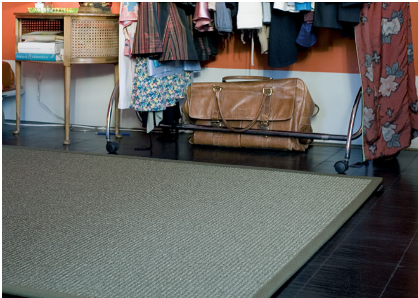
Manila 40161 schlamm