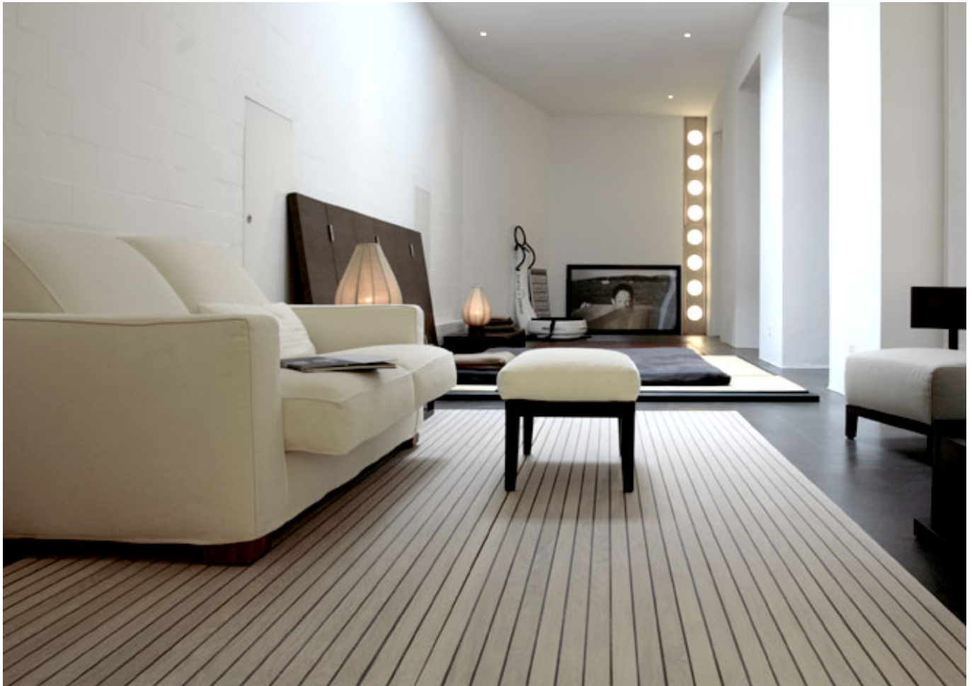
Legno-Legno 236 (Quercia trattata con mordente)