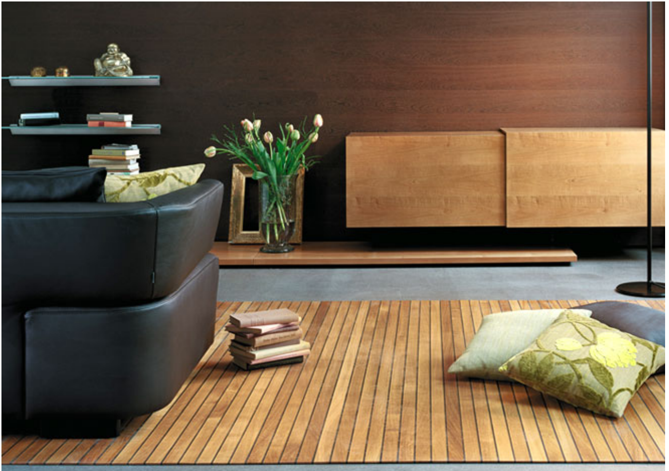
Legno-Legno 205 (Quercia oliata)