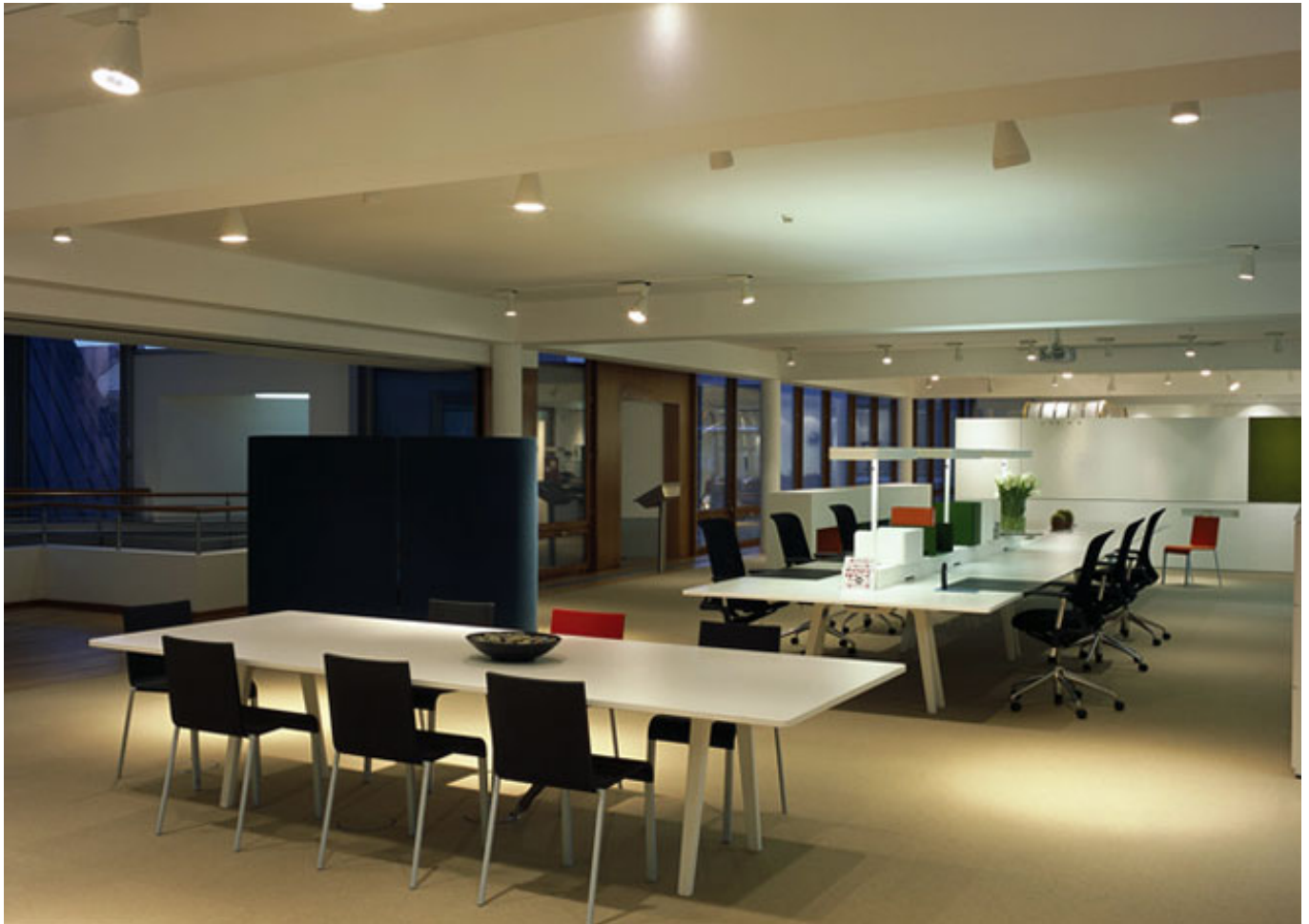
Flatwool Simple 288