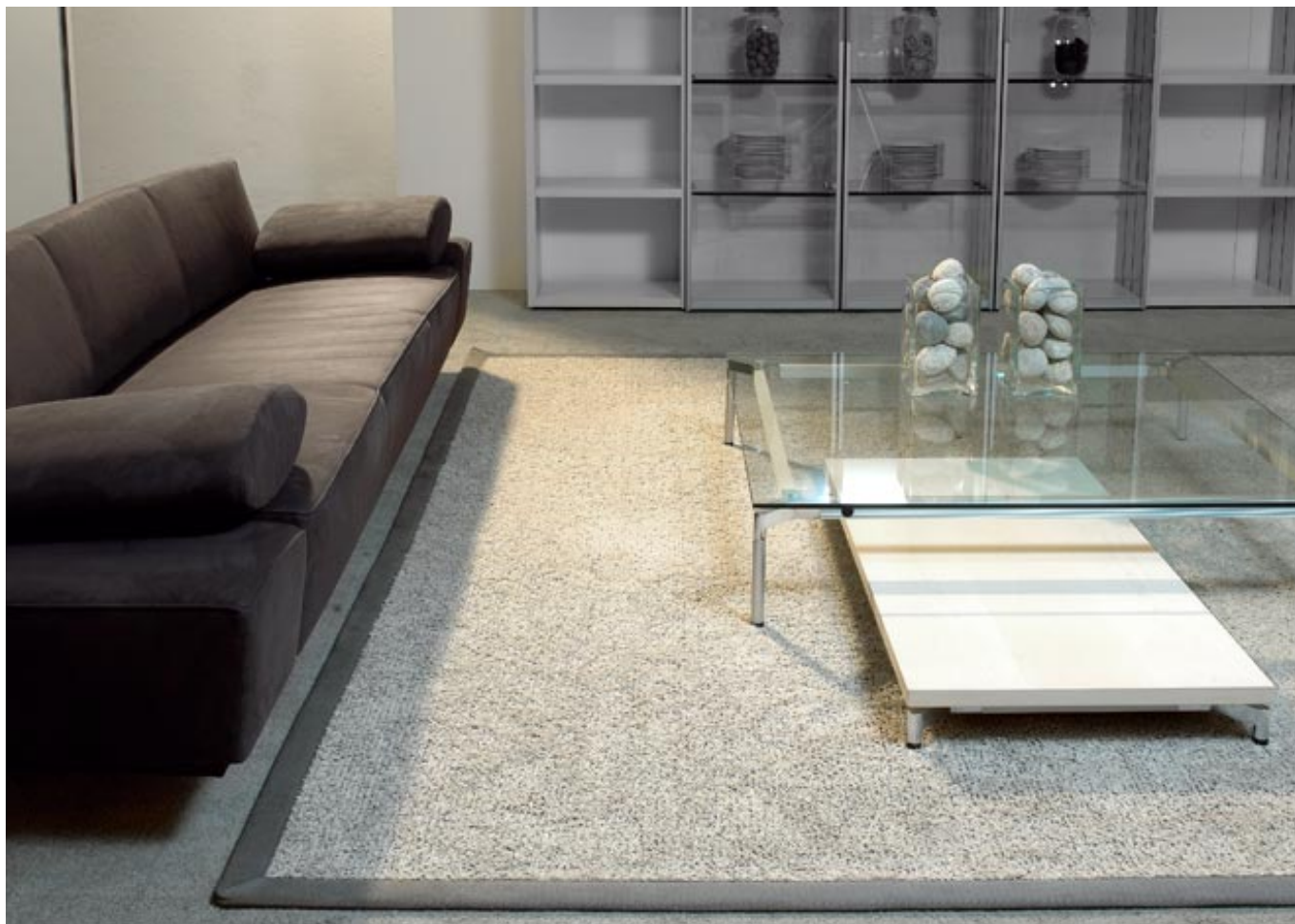
Get up 635